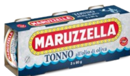
Immagine prodotto Image

Costa d'Avorio / Madagascar Ivory Coast / Madagascar